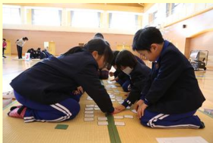
次々と札を取る低学年チーム

この日のために百人一首を覚えてきた児童たちは、時折お手付きはあるものの、素早い手さばきで札を取り合っていました。