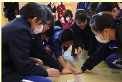
白熱した対戦を見せる高学年チーム