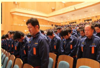
殉職消防団(職)員への黙とう