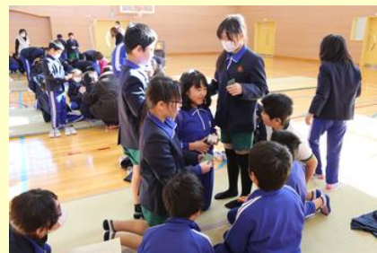
取った札の枚数を集計