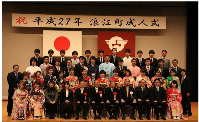
請戸・幾世橋地区