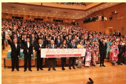
東京五輪カウントダウンイベント