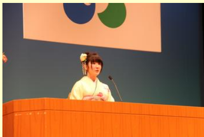
二十歳のメッセージ