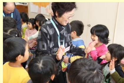
ハイタッチでお見送り