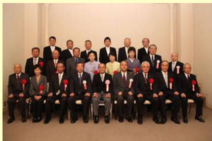
受賞者と市関係者の記念撮影

市では、南相馬市表彰式を原町区のロイヤルホテル丸屋で開催し、市政の伸展や教育の復興、社会福祉の増進、消防などに貢献された方々13人を表彰しました。