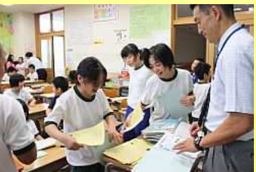
宿題やってきました