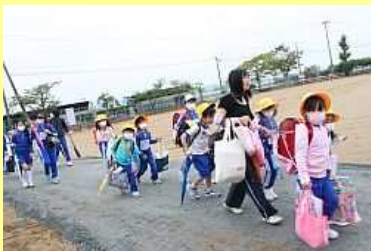
元気に登校「おはようございます」

小・中学校の在籍数は、1学期に比べ、小学校では132人、中学校では107人がそれぞれ転入などで増加しました。