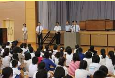
新しい先生の紹介