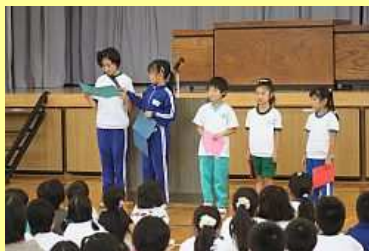
夏休みの思い出を発表