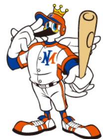
新潟アルビレックスBC マスコットキャラクター アルファくん

交通案内 循環バス「ぐるっとさん」 ★道路状況などにより時刻が遅れることがあります。