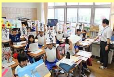
上手にできました！