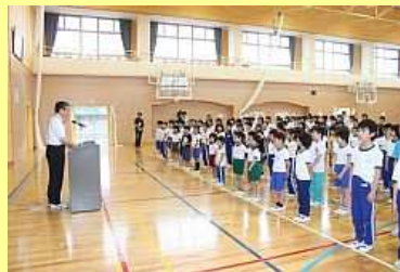
児童数も増えました