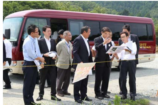
太陽光発電事業概要を説明(富岡工業団地)