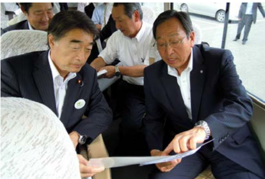
移動中も引き続き事業概要を説明する宮本町長(右)