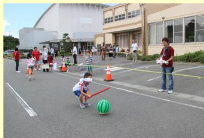
スイカはすぐそこ 当たるかな？