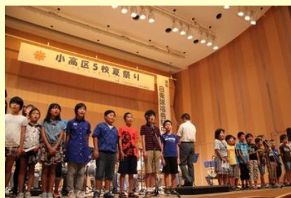
演奏に合わせて 「Let it go」を歌う児童たち