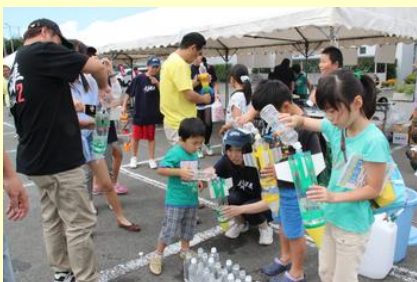
水ロケットに水を入れる 子どもたち