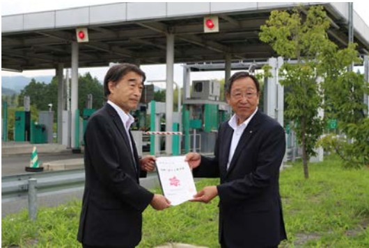
根本復興大臣(左)に要望書を手渡す宮本町長

これを受け、根本大臣は「双葉郡内の町村の置かれている状況は各々異なるが、確実に復旧・復興に向かっている。これからも町、県、国がスクラムを組み、更なる加速化が図れるよう政府も後押しをする。」と述べました。