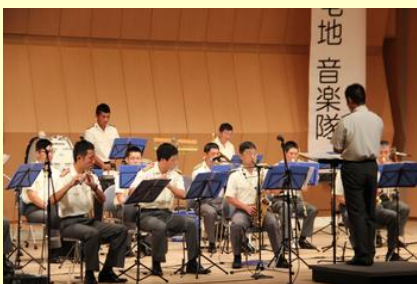
楽しい音楽が響き渡った 自衛隊音楽隊の演奏

会場には、スイカ割りや輪投げ、ペットボトルロケットなどさまざまなコーナーが設けられ、自衛隊音楽隊の見事な演奏も披露されました。自衛隊の演奏に合わせて児童生徒が「アナと雪の女王」の主題歌「Let it go」を歌う場面もあり、子どもたちは祭りを満喫していました。