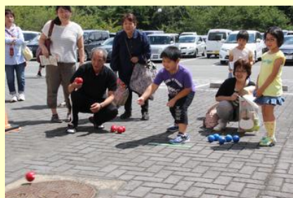
ペタンク楽しいね