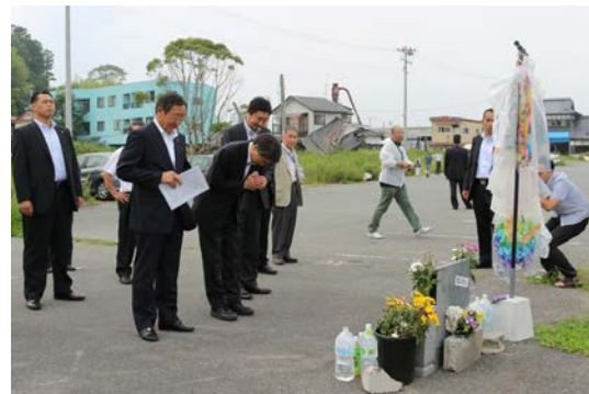
東日本大震災慰霊碑に手を合わせる根本大臣 (JR富岡駅)