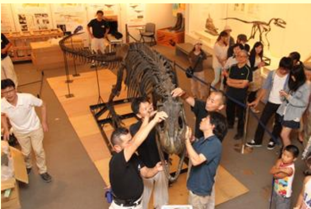
最後に頭部を付けて