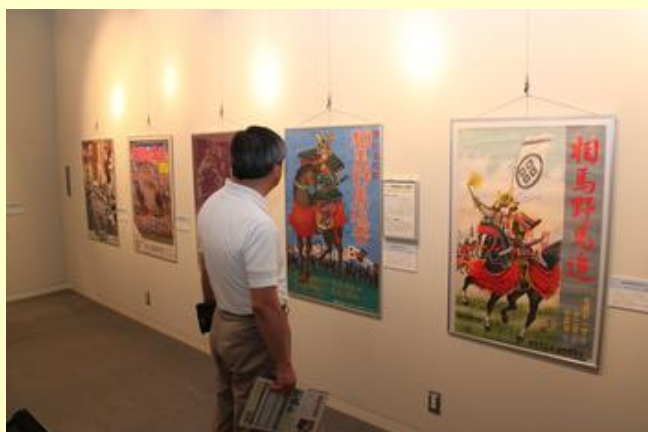
日程変更の変遷が分かる歴代ポスター