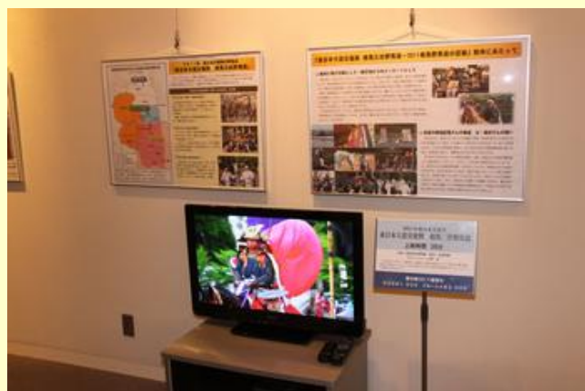
映像作品「東日本大震災復興 相馬三社野馬追」