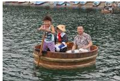
たらい舟にも乗って… 船頭さんも体験