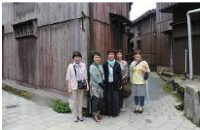
宿根木地区散策 JR東日本CMでおなじみの場所で 吉永小百合気分???