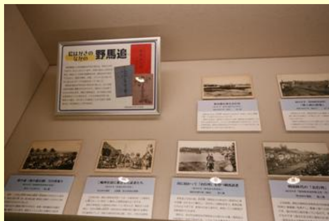
絵はがきで見る野馬追