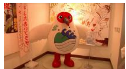
サドッキーもいたよ!!