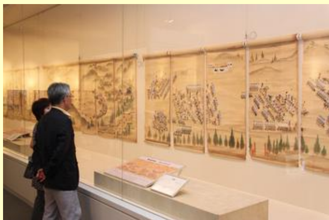
本邦初公開となる「奥州相馬氏野馬追図屏風」

今回の特別展では、その時代の手法で“ビジュアル化”された野馬追の歴史を絵画や写真、映像などで振り返るもので、本邦初公開の「奥州相馬氏野馬追図屏風」をはじめ、さまざまな資料が展示されています。特別展は、7月28日（月）までです。