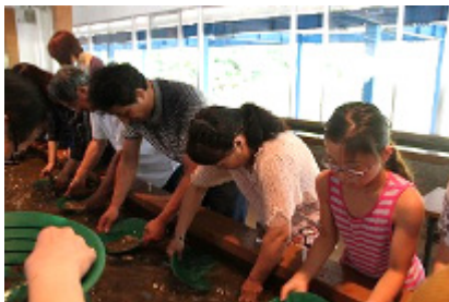
西三川ゴールドパークで砂金採り

海上は真っ黒な雲におおわれ、雨。遠くで雷が光り不安定な天候でしたが、佐渡に到着すると雨も上がり、午後からは日差しも強くなりました。観光中も傘を差すこともなく、思ってもいない最高の一日となりました。