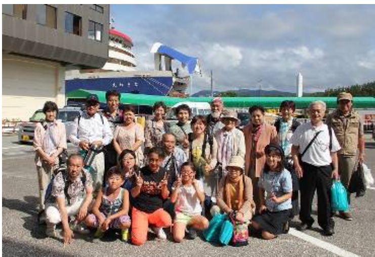
参加者全員で…「はい。チーズ」 楽しい1日でした