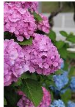
紫陽花も見頃でした