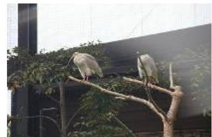
トキの公園では間近に見られました