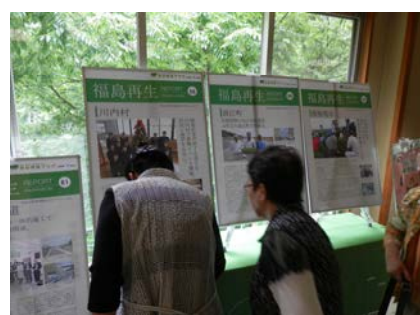
除染情報プラザのブース