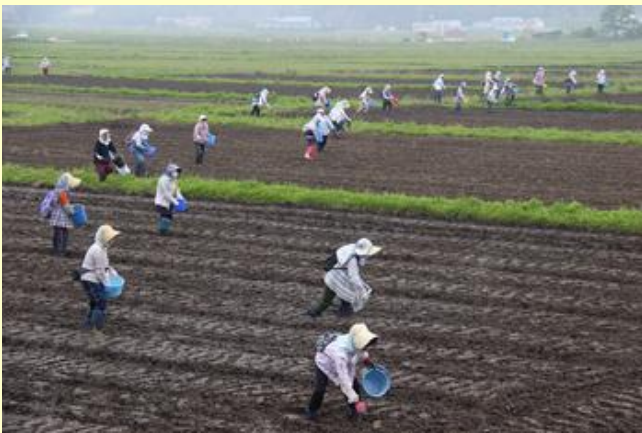
満開の花を期待して

今回は、8月に予定されている特例宿泊と夏祭りイベントに合わせて、住民など約80人がヒマワリやコスモスなどの種をまきました。