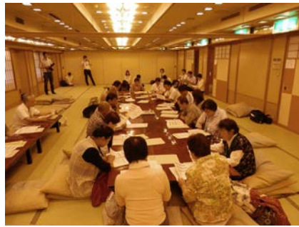
南相馬市の地域会