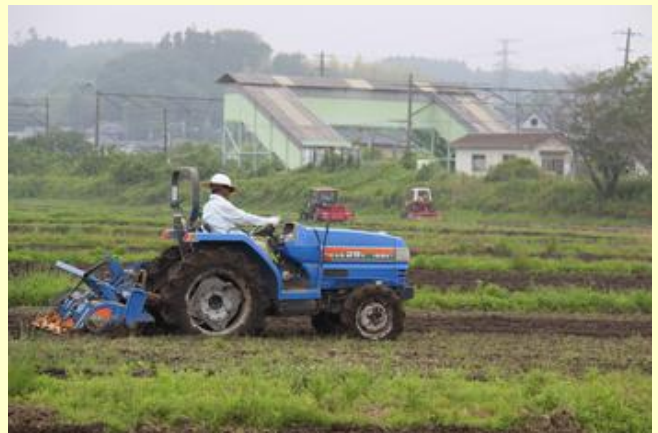
トラクターも活躍