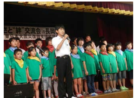
山古志小中学校の皆さん