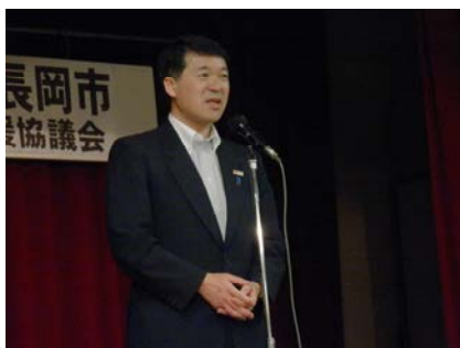
泉田新潟県知事のあいさつ