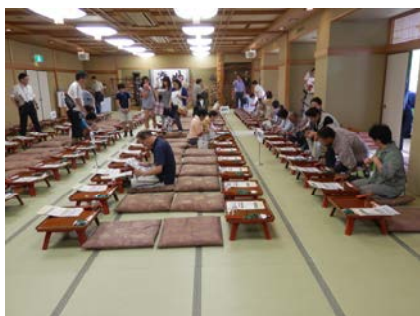
全体会が行われた大広間