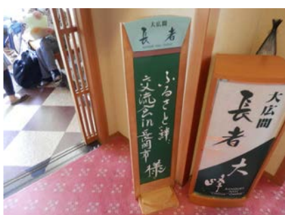
全体会会場入り口