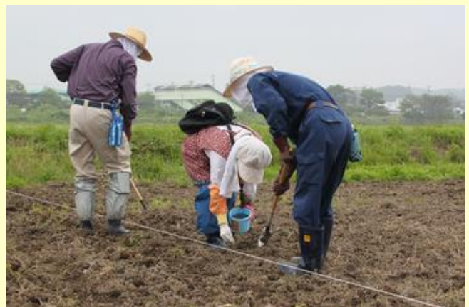
ヒマワリの種まき