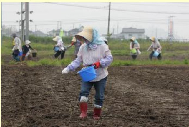
コスモスの種まき