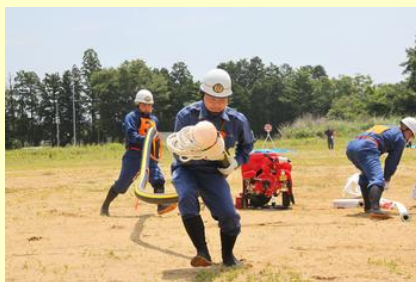
正確で迅速な動作