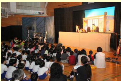
いきいきとした人形の動き