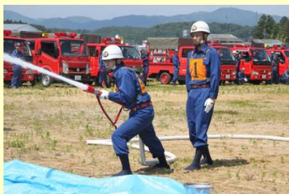
日頃の練習の成果を発揮