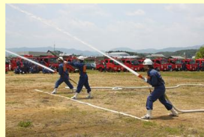
ポンプ車操法の展示