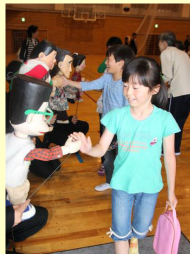
人形とハイタッチ