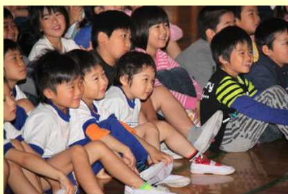
人形劇の魅力に笑顔いっぱい