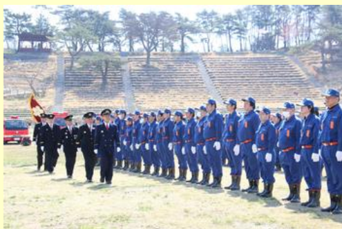
通常点検を受ける団員