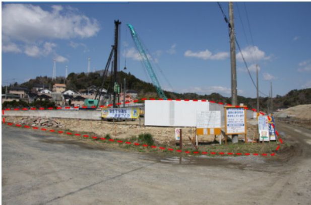
着工状況 平成26年4月7日(月)現在