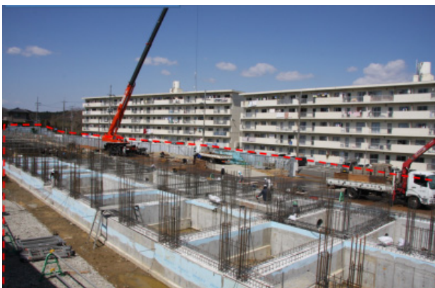
着工状況 平成26年4月7日(月)現在