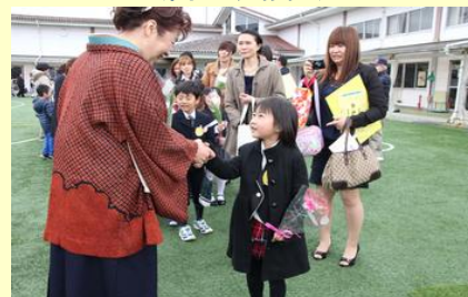
元気でね(鹿島幼稚園)