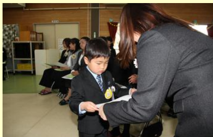
お母さんありがとう!(鹿島幼稚園)