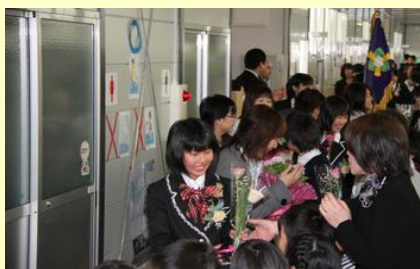
3校合同(福浦・金房・鳩原)