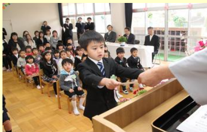
園長先生から修了証書(高平幼稚園)