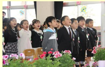
元気よく園の歌を歌う卒園児 (高平幼稚園)