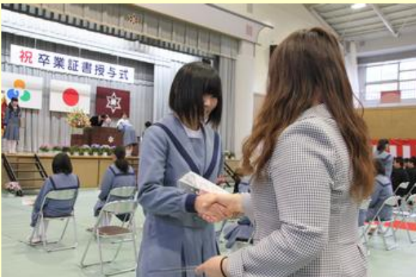
卒業証書を保護者に手渡し握手(原三中)