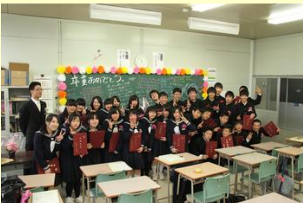
教室で記念撮影(小高中)