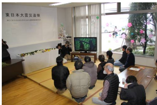
政府主催追悼式典の中継を見る皆さん

震災時刻の午後2時46分には、お亡くなりになられた方へのご冥福をお祈りし、黙とうを捧げました。