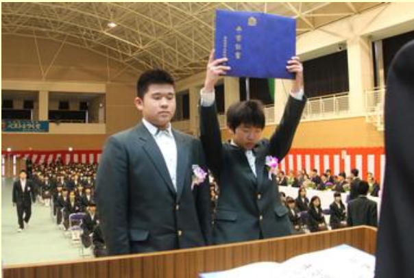
卒業証書の授与(原一中)

市内の公立中学校では卒業式が行われ、384人が慣れ親しんだ学びやから巣立ちました。このうち、原町第一中学校では新しい体育館で行われ、原町第三中学校では卒業生が卒業証書を保護者に手渡し感謝を述べる場面もありました。卒業生は、在校生や先生に見送られ、さまざまな思いを胸に新たな一歩を踏み出しました。