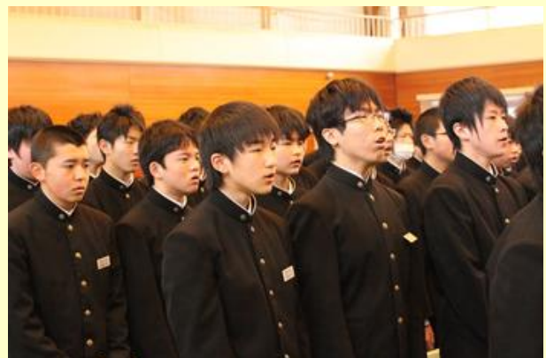
最後の校歌(鹿島中)