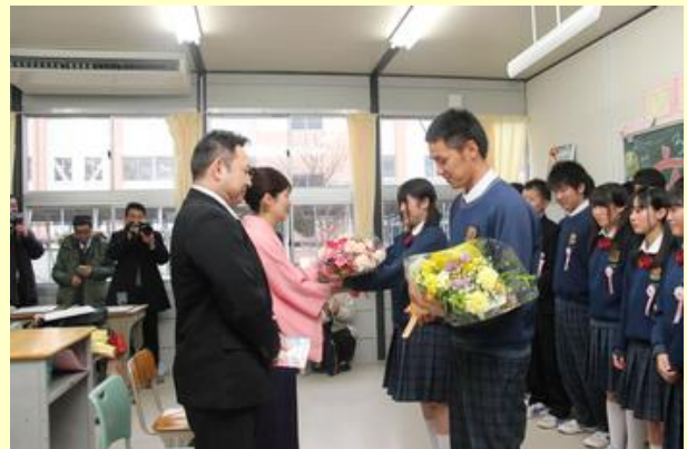
感謝を伝える卒業生(石神中)