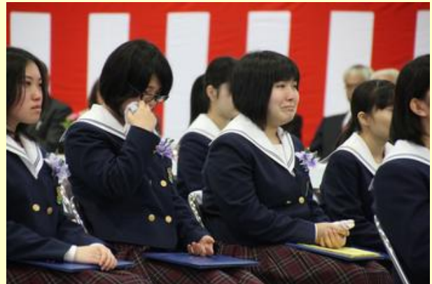
思いが込み上げ、涙(原二中)