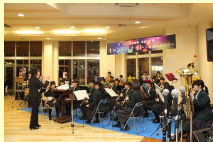
原町第一中学校吹奏楽部