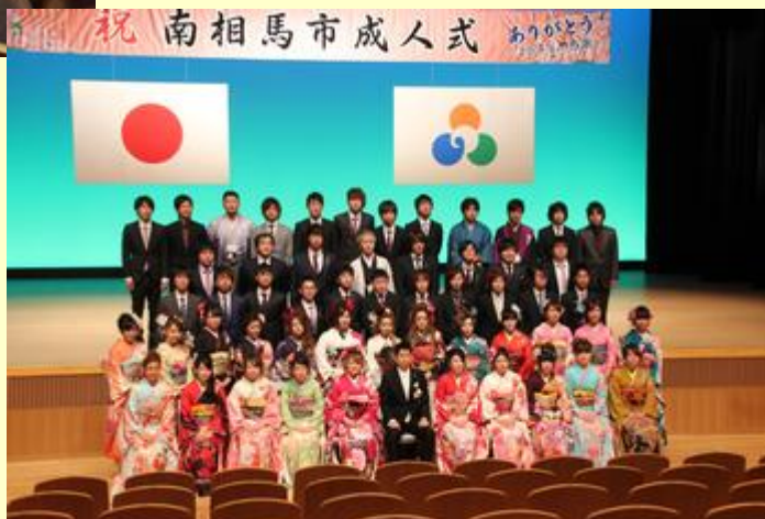
出身中学校ごとに記念撮影