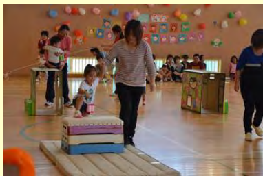
ママと一緒に(かみまの保育園)