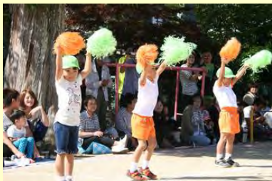
ハロー、サンキュー！～ばなな天国 (高平幼稚園)

また、さゆり幼稚園では、園庭が人工芝になって初めての運動会。緑の芝生が園児の競技とともに輝いていました。