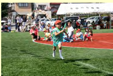
最後までがんばって(さゆり幼稚園)