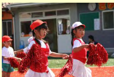
さよならクロール(さゆり幼稚園)