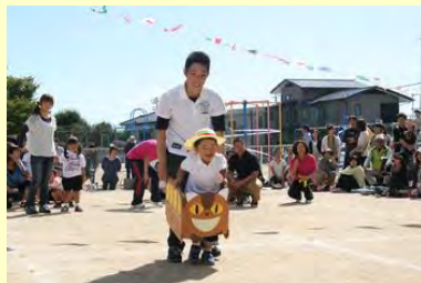
バスにのってゴーゴー！ (高平幼稚園)