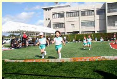
ゴールはもうすぐ(さゆり幼稚園)