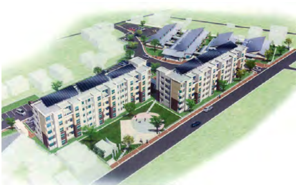
大町(東地区)災害公営住宅