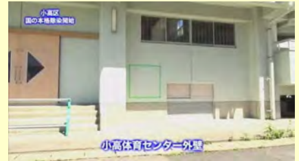
小高体育センター外壁