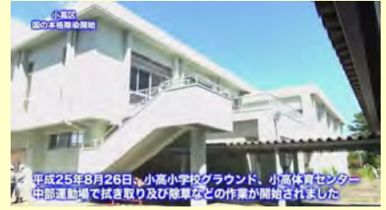
平成25年8月26日、小高小学校グラウンド、小高体育センター、中部運動場で拭き取り及び除草などの作業が開始されました