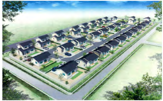
鹿島区西川原第一災害公営住宅