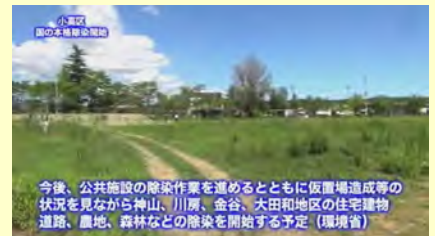
今後、公共施設の除染作業を進めるとともに仮置場造成等の状況を見ながら神山、川房、金谷、大田地区の住宅建物、道路、農地、森林などの除染を開始する予定（環境省）

今後、公共施設の除染作業を進めるとともに仮置場造成等の状況を見ながら、神山、川房、金谷、大田地区の住宅建物、道路、農地、森林などの除染を開始する予定です。（環境省）