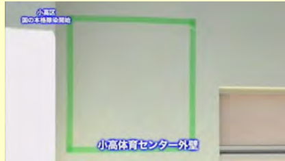
小高体育センター外壁