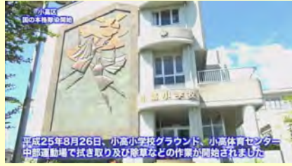
平成25年8月26日、小高小学校グラウンド、小高体育センター、中部運動場で拭き取り及び除草などの作業が開始されました