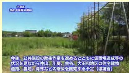
今後、公共施設の除染作業を進めるとともに仮置場造成等の状況を見ながら神山、川房、金谷、大田地区の住宅建物、道路、農地、森林などの除染を開始する予定（環境省）