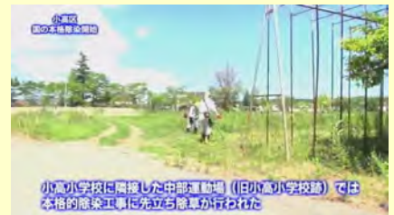
小高小学校に隣接した中部運動場（旧小高小学校跡）では本格的除染工事に先立ち除草が行われた