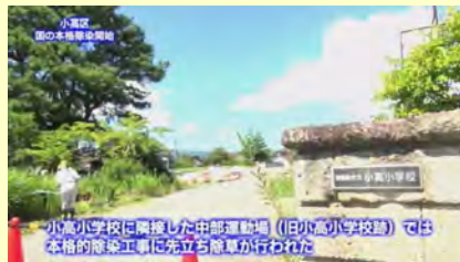
小高小学校に隣接した中部運動場（旧小高小学校跡）では本格的除染工事に先立ち除草が行われた