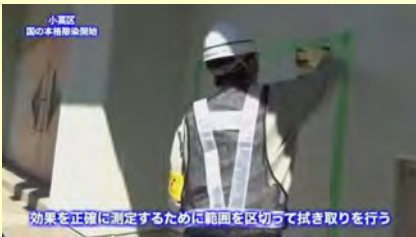
効果を正確に測定するために範囲を区切って拭き取りを行う