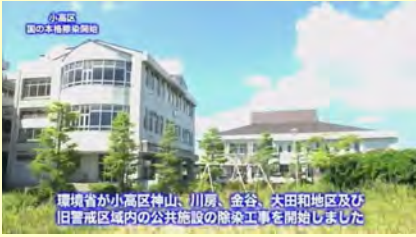
環境省が小高区神山、川房、金谷、大田地区及び旧警戒区域内の公共施設の除染工事を開始しました