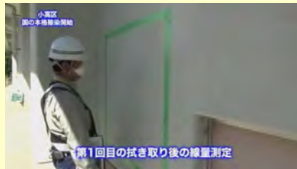
第1回目の拭き取り後の線量測定