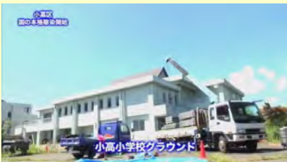
小高小学校グラウンド