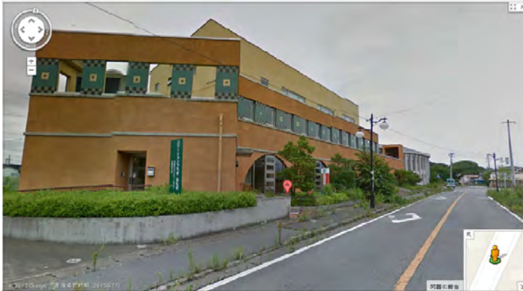
画像は双葉町のステーションプラザふたば