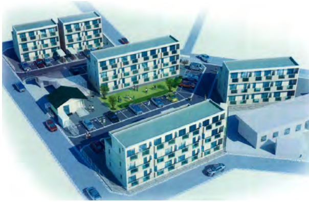
鹿島区西町災害公営住宅