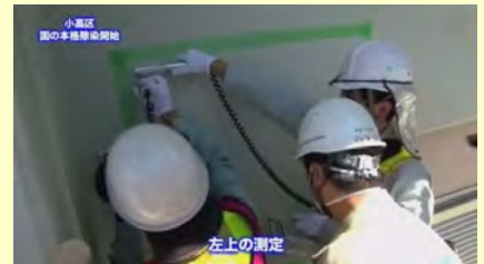
左上、左下、右上、右下の線量測定（この作業を3回繰り返す）