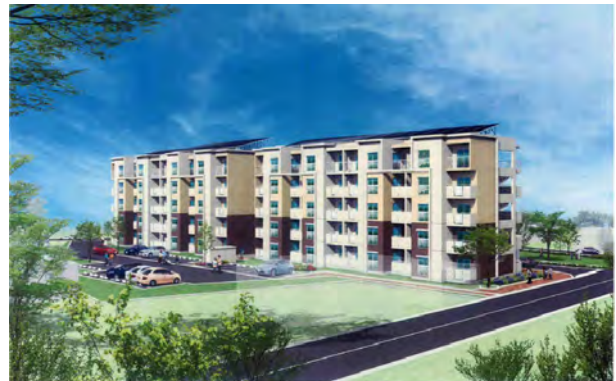
大町(西地区)災害公営住宅