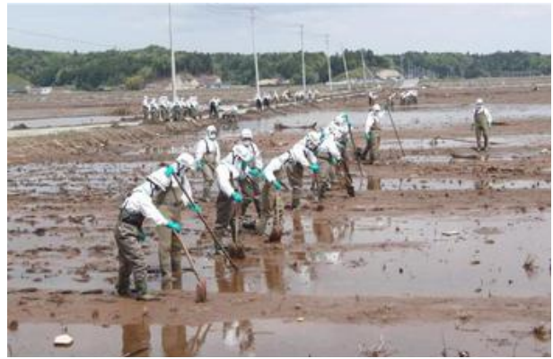
平成23年5月13日 福島県警および警視庁による合同捜索 (南相馬市小高区)