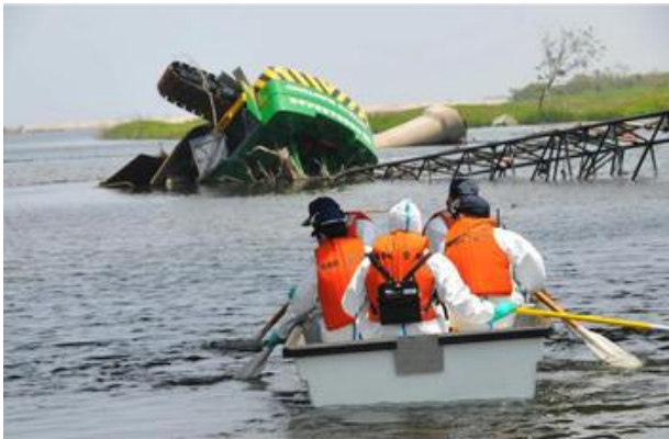
平成23年6月20日 請戸川を捜索する機動隊員 (浪江町請戸)