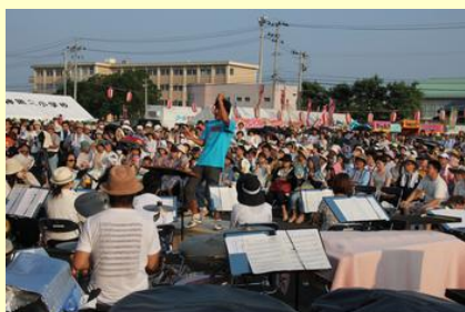
シエナ・ウインド・オーケストラ