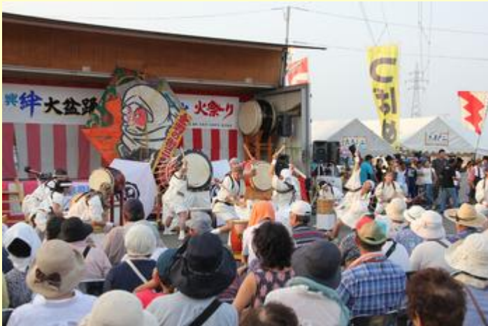
「三小相承会」の三條太鼓

原町区の牛越応急仮設駐車場で「復興 絆 大盆踊り 打上げ花火 火祭り」が行われ、仮設住宅の入居者や地元住民、お盆で里帰りした避難者でにぎわいました。