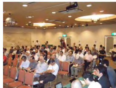
説明会会場の様子

今後も、原子力損害賠償紛争解決センターへの申立ての内容についての経過状況を様々な形でできる限り詳細にご説明していく予定です。