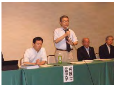
日置弁護団長による説明の様子

説明会では、約100人の参加者の前で、現在までの申立ての状況や今後の展望について、浪江町支援弁護団から説明が行われました。その後の質疑応答においては、様々な質問・意見が出され、最後に浪江町がこの辛い状況を訴えて行くには、浪江町や弁護団だけではなく、町民全体が一体となりこの取り組みを進めて行く必要があるという心強いご意見を頂きました。