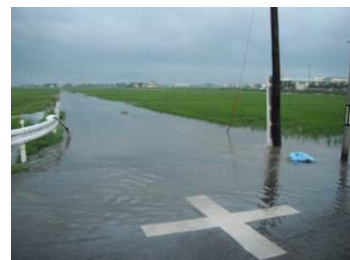
安積町荒井(道路・農地冠水)