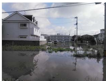
田村町徳定(浸水被害)