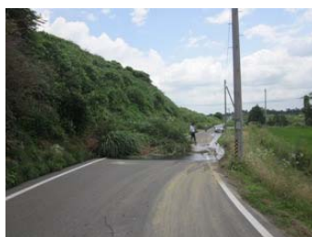
熱海町安子ヶ島(法面崩落)