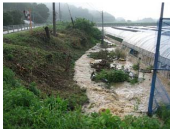
逢瀬町河内(農地冠水)