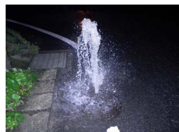
日和田町高倉(マンホールからの噴出)