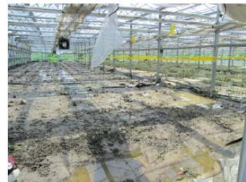
逢瀬町河内(農業施設被害)