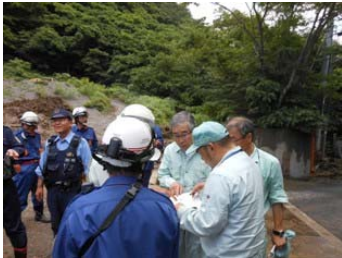
品川市長による現地対応