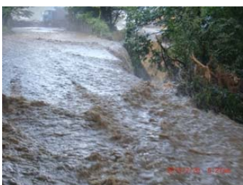
熱海町安子ヶ島(道路崩落)