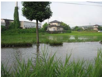
大槻町福良沢(道路・農地冠水)