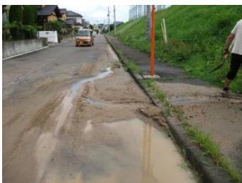
緑ヶ丘第一小(法面土砂流出)