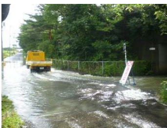
片平町庚坦原(道路冠水)