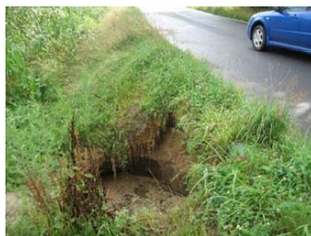
安積町日出山(道路損壊)