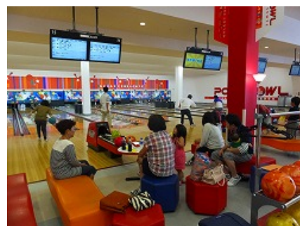
前回の親睦会の様子です