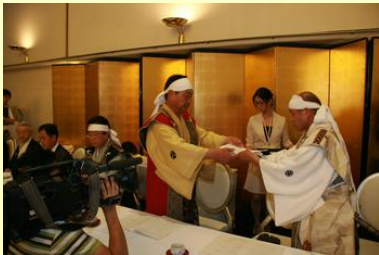
推戴辞令・肩証交付(副大将)

なお、今年の相馬野馬追は7月27日(土)～29日(月)の3日間、429騎の騎馬が参加して行われます。