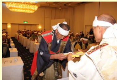
役付辞令・肩証交付(軍師)