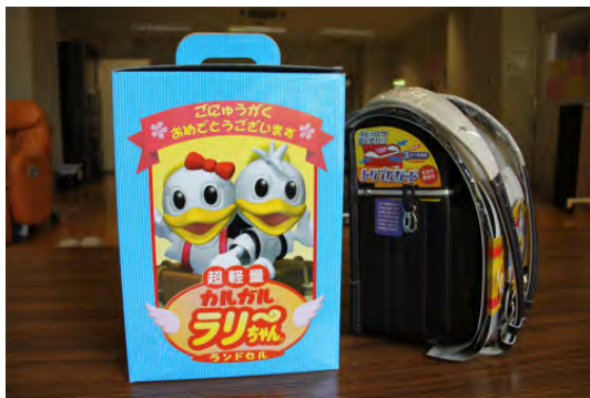
ランドセル 色 チョコレート (男女兼用)