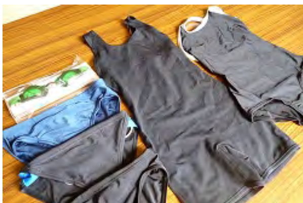
男子用水着 サイズ 120～140 (各サイズ3～4着程度) 女子用水着 サイズ 120～140 (各サイズ3～4着程度)