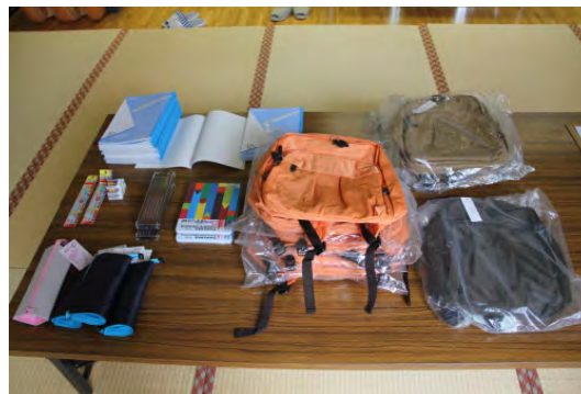
リュックサック 色 ブラウン ベージュ オレンジ ノート・鉛筆・色鉛筆・筆入れ ほか