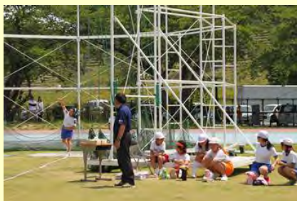
ソフトボール投げ