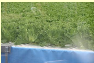
子どもたちが種をまいた レタスが立派に育ちました。

3月11日子どもたちが種まきをしたレタスも立派に育ち、今日が初出荷。レタスを積み込んだトラックがみんなに見送られながら出発しました。