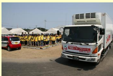
みんなに見送られて初出荷