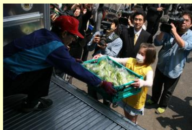
トラックにレタスを積み込み