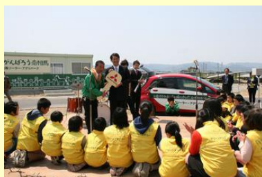
子どもたちのために 電気自動車が贈られました。