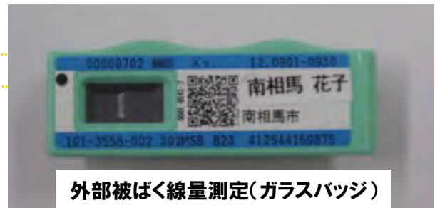
外部被ばく線量測定(ガラスバッジ)