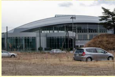
スポーツセンター 中央台 【空間線量率:毎時8.5マイクロシーベルト】