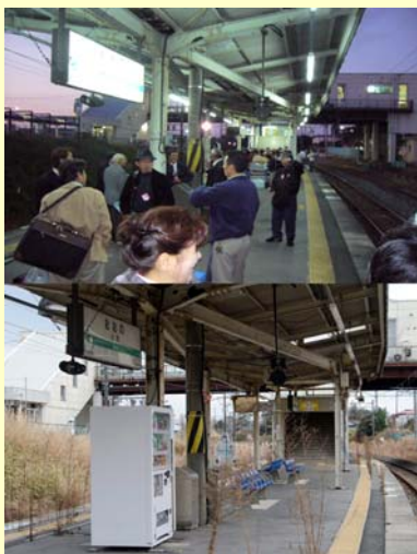
大野駅ホーム 大野 【空間線量率:毎時9.0マイクロシーベルト】