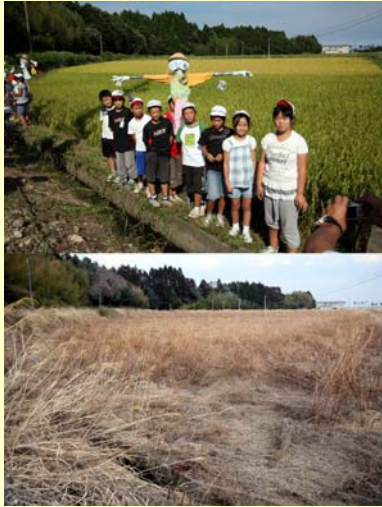
熊川地区水田 久麻川 【空間線量率:毎時20.0マイクロシーベルト】