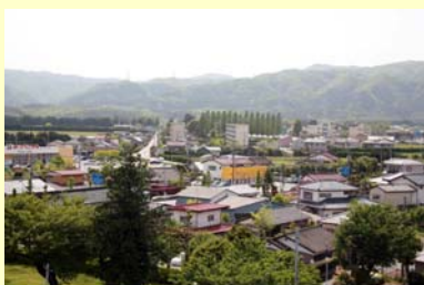
大熊町役場庁舎屋上からの風景 大野 【空間線量率:毎時2.5マイクロシーベルト】