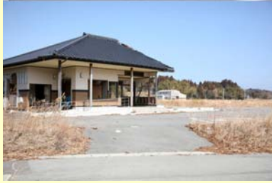
熊川地区集会所 久麻川 【空間線量率:毎時5.1マイクロシーベルト】