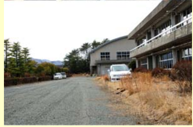
大熊中学校 中央台 【空間線量率:毎時5.7マイクロシーベルト】