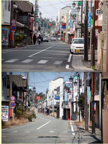
大野商店街 大野【空間線量率:毎時5.0マイクロシーベルト】