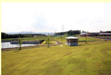
ふれあいパークおおくま 南台【空間線量率:毎時17.0マイクロシーベルト】