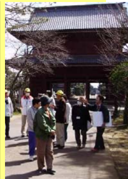
本成寺まちあるき イベントでの一枚