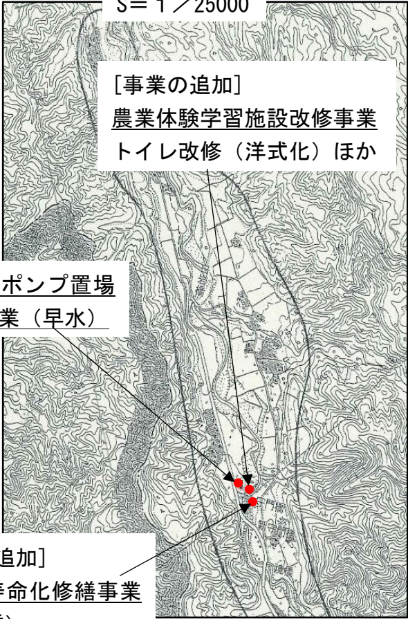
詳細図 2 S= 1 / 25000