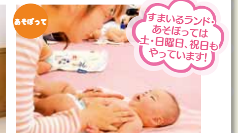
《わらべうたベビーマッサージ》 親子の心がつながるコミュニケーション!