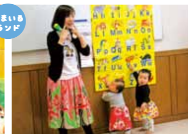
《英語deハワイアンリトミック》 かわいいバスケットの貸し出しもあります。