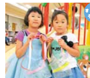
《自由に作ってあそぼう》 ビニール袋でお手製の ショルダーバックが出来ました。