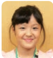
うらだてしょうがっこう 裏館小学校 4年