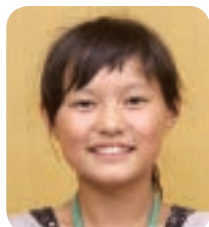
おおもしょうがっこう 大面小学校 5年