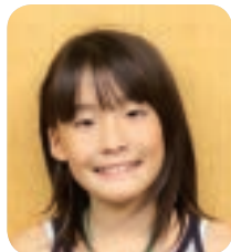
うらだてしょうがっこう 裏館小学校 4年