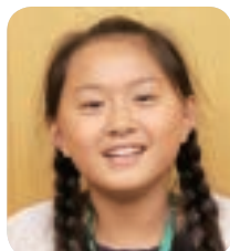
さかえちゅうおうしょうがっこう 栄中央小学校 5年