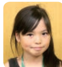
うらだてしょうがっこう 裏館小学校 4年

に行き、いろいろなぶどうを知りました。これからもいろいろなぶどうを食べたいです。