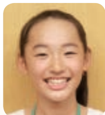
おおもしょうがっこう 大面小学校 5年