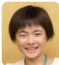
おおもしょうがっこう 大面小学校 5年