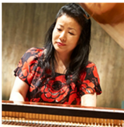
一番星ピアノ教室講師