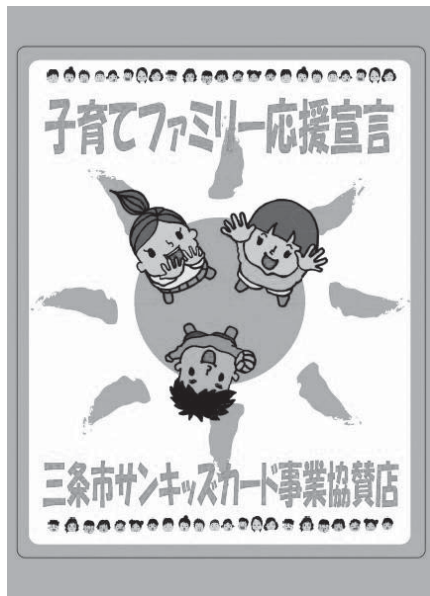
協賛店のステッカー