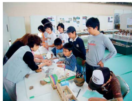
土器カード作りにチャレンジ