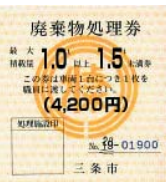
廃棄物処理券 みほん