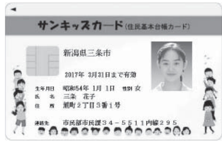
サンキッズカード

対象者でサンキッズカードを希望する方は、市民窓口課、栄・下田サービスセンターまで申請してください。