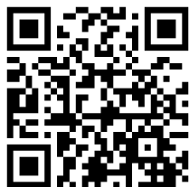
株式会社いすゞ製作所