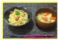
パッククッキングで 作った親子丼と 具だくさん汁