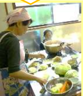
お膳のかたちで 栄養バランスもばっちり！