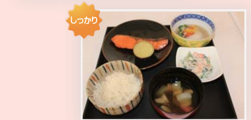
2018年3月14日のプレス発表で提供したスマートミール (女子栄養大学レストラン 松柏軒 調製)

7つの学協会からなる「健康な食事・食環境」コンソーシアムが審査・認証を行います。