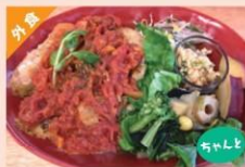
鶏肉のトマトプレート ¥1,300