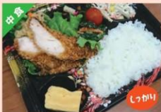
醤油麹に漬けたさしみフライ弁当 ¥538