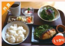
カラスカレイのつけ焼き定食 ¥1,200 ⇒ ¥1,370円