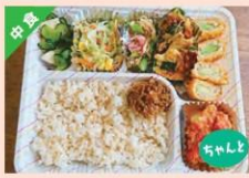
旬菜バランス弁当 ¥648