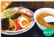
野菜たっぷりカレーつけ麺 ¥1,100