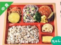
豆腐ハンバーグ トマトソース弁当 (雑穀米) ¥550