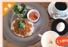
ベジキーマカレーセット ¥1,210