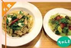
季節野菜とモッツアレラチーズのペペロンチーノ ¥1,450