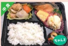
いきいき弁当 ¥600 ⇒ ¥700円