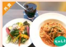
トマトソースパスタ (週替り) ¥1,500