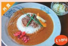
手造ポークカレー ¥1,700 ⇒ こくわかカレーレギュラー・炙り豚トッピング