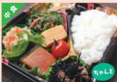
ヘルシー和食弁当 ¥538

※表示価格は、全て税込の価格です。 ※価格高などの理由により、価格や内容を変更する場合があります。