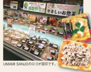
UMAMI SANJOのロゴが目印です。