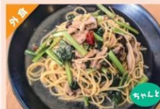
アンチョビツナとキノコのペペロンチーノ ¥1,480