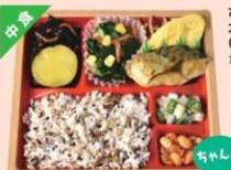
さばのカレー風味焼き弁当 (雑穀米) ¥550