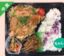
野菜たっぷり生姜焼き弁当 (白米) ¥646