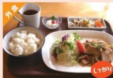
豚のしょうが焼き定食 ¥1,200 ⇒ ¥1,320円