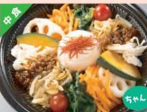
1日1/3野菜が摂れる旨辛美ピンパ丼 ¥538