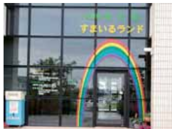
三条市役所栄庁舎

子育て拠点施設 すまいるランド TEL:0256-45-5687(三条市新堀1311) 【開館時間:9:00～17:00】 三条市立図書館 栄分館 TEL:0256-45-5686 【開館時間:月～金曜日 9:30～19:00 土・日曜日・祝日 9:30～17:00】 【上記施設の休館:第3月曜日、月末(月末が土・日・月曜日の場合は直前の金曜日、年末年始(12/28～1/3))】