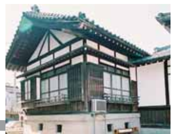
旧武徳殿 記念室(旧貴賓室)