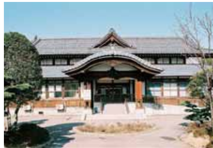
三條市歴史民俗産業資料館(旧武徳殿)

三條市の歴史を手っ取り早く知るならこの施設。原始・古代から現代までの歴史、三條出身の芸術家の作品が展示されています。また、この建物は三條市で初めて、国登録有形文化財に登録されました。 (TEL:0256-33-4446 三條市本町3-1-4) 【休館：月曜日、毎月末日(土・日・祝日は開館)、年末年始12/29~1/3】 ■入館無料