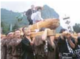
ただふるさと祭り ～雨生の大蛇祭～