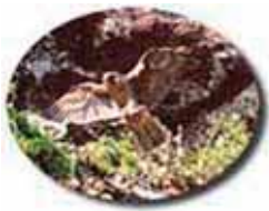
県の指定天然記念物 ～ハヤブサ～