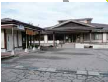
農家レストラン 悟空