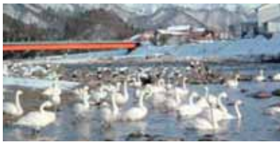
毎年11月上旬に白鳥がきます。