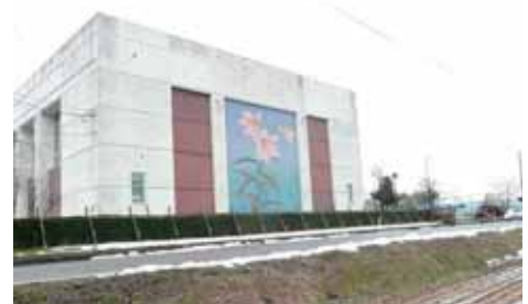
ウェルネスしただ

ウェルネスしただは、アリーナ、研修室(和室)、トレーニングルーム、二階には郷土資料館があります。また、外にはテニスコート一面と交流広場があります。ひめさゆりの壁画がきれいです。(TEL:0256-46-5110 三条市飯田1029-1) 【休館：年末年始12/29～1/3】