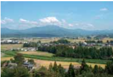
城山からの見晴らし