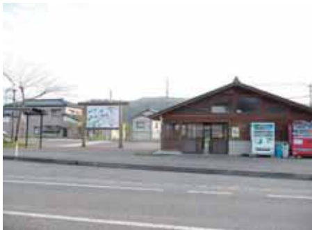
ひめさゆりパーク