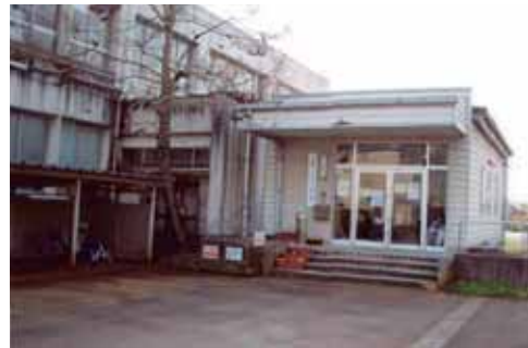
リージョンセンター