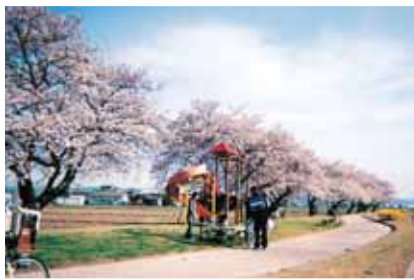
新川と柳川緑地帯公園の桜