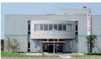
三条下水処理センター