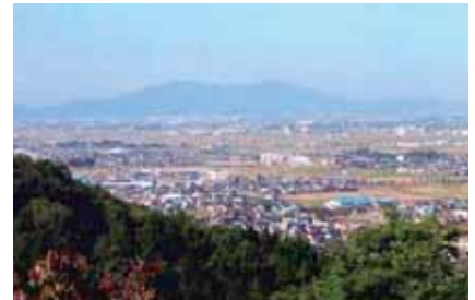
見晴台よりの眺望