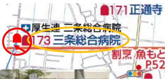
正面玄関から移設