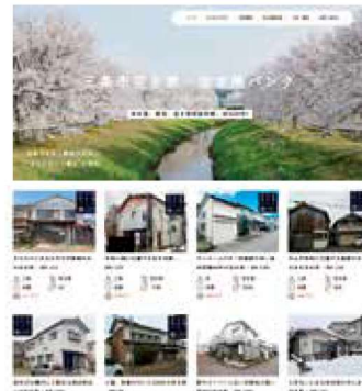
空き家・空き地バンク