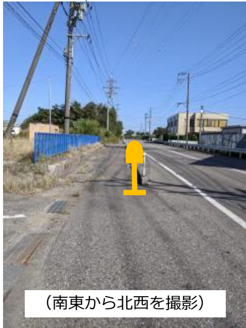
(南東から北西を撮影)