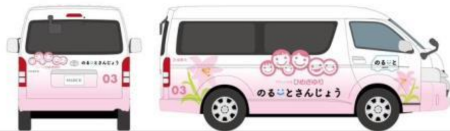
ワンボックスタイプ