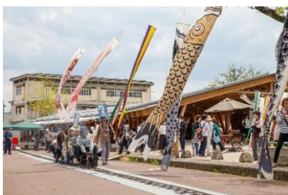
ぐるっとえんがわ周遊