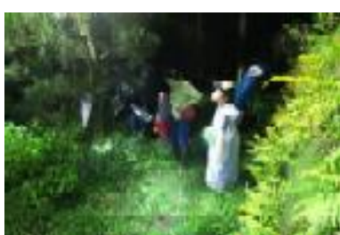
里山ナイトウォーク観察会