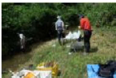
身近な水環境調査